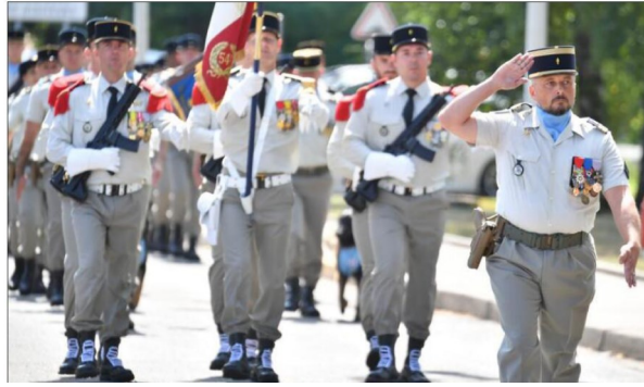
Le Colonel Damien Le Madec au premier plan

C'est sous un soleil radieux que Le Colonel Damien Le Madec a pris le commandement du 54ème Régiment de Transmissions au Camp d'Oberhoffen. La Cérémonie a commencé par la présentation du drapeau aux dernières recrues qui ont reçu leur képi des mains de leur parrain. S'en est suivie une remise de décoration.