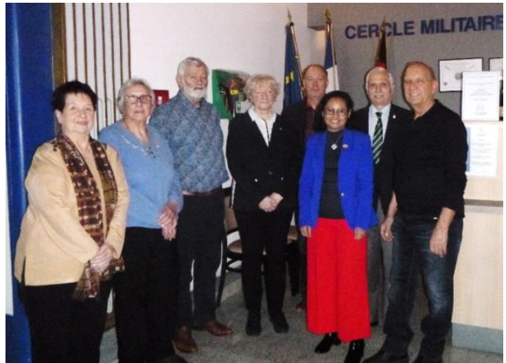
14 mars – bureau (partiel)

Du 01.02.22 au.31.03.2022 1 460 visiteurs 6 520 pages vues