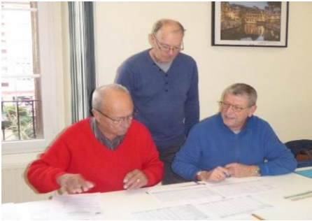
18 janvier contrôle des comptes