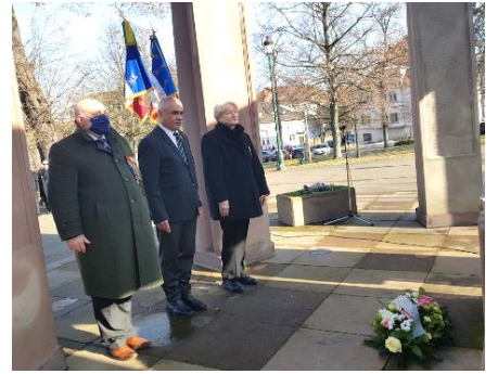
12 février Dépôt de gerbe