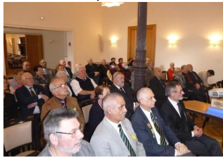
18 février AG 236°