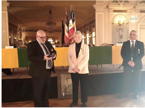
12 février Départ Pdte UD