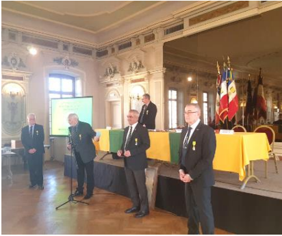
12 février UD 67 nouveau bureau